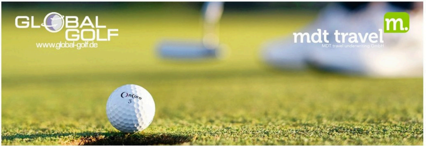
Änderungen vorbehalten, Stand: 02/2026